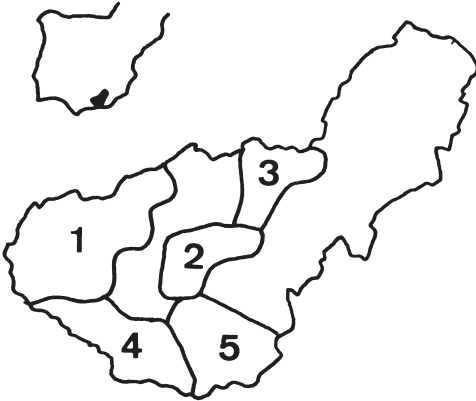
FIG. 1.—Localización del área de estudio y comarcas consideradas. 1: Sierras Subbéticas; 2: Sierra Harana; 3: Depresión de Guadix; 4: Sierras de Almirajara, Lújar y Tejada; 5: Alpujarra-Contraviesa. Véase el texto para más detalles.

La alimentación durante la temporada reproductiva se basó en el consumo del conejo y de la Perdiz Roja (Tabla 2). En general la dieta resultó similar en todas las comarcas consideradas (test de Friedman: \chi^2 = 0,657 , g.l. = 4, n.s.), exceptuando el caso de las Alpujarras-Contraviesa ( \chi^2 con cada uno del resto de las comarcas, P < 0,0001 , g.l. = 6 en todos los casos), donde las principales presas fueron las palomas y los pequeños mamíferos (Tabla 2). La alimentación fue constante en el tiempo (test de Friedman \chi^2 = 1,829 , g.l. = 4, n.s.; Fig. 1). Si bien se observó una tendencia temporal a la disminución del conejo (Fig. 1), ésta no fue significativa ( r_s = 0,859 , P = 0,062 , g.l. = 4).